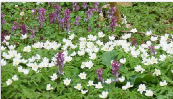
Der Frühling ist da.

Lerchensporn und Buschwindröschen im Brühler Schlosspark