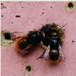
Gehörnte Mauerbiene ( Osmia cornuta ) Flugzeit März bis Mai