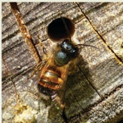
Rostrote Mauerbiene ( Osmia bicornis ) Flugzeit März bis Juni