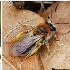
Rotschopfige Sandbiene ( Andrena haemorrhoa ) Flugzeit April bis Juni