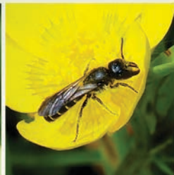
Hahnenfußscherenbiene ( Chelostoma florissomne ) Flugzeit Ende April bis Juli