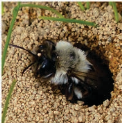
Weidensandbiene ( Andrena vaga ) Flugzeit März bis Mai