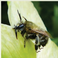
Frühlingspelzbiene ( Anthophora plumipes ) Flugzeit März bis Mai