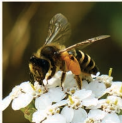
Gewöhnliche Bindensandbiene ( Andrena flavipes ) Flugzeit März bis Mitte Mai