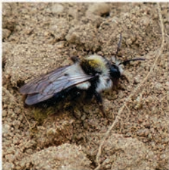
Aschgraue Sandbiene ( Andrena cineraria ) Flugzeit April bis Mai