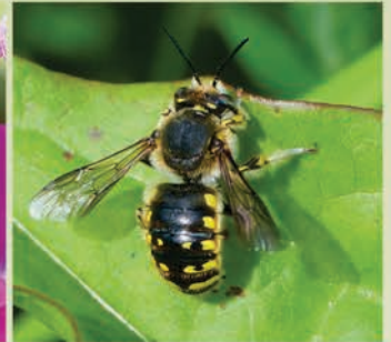
Große Wollbiene ( Anthidium manicatum )