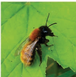
Fuchsrote Sandbiene ( Andrena fulva ) Flugzeit Ende März bis Mai