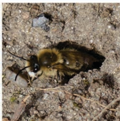
Frühlingsseidenbiene ( Colletes cunicularius ) Flugzeit März bis Mai