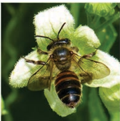
Zaunrübensandbiene ( Andrena florea ) Flugzeit Mai bis August