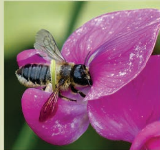
Blattschneiderbiene ( Megachile willughbiella )

Einzelne Wildbienenarten zu unterscheiden ist gar nicht so leicht. Eine Kombination aus Aussehen, Flugzeit, Nistplatz und bei den Spezialisten manchmal auch die Blütenwahl kann erste Anhaltspunkte geben.